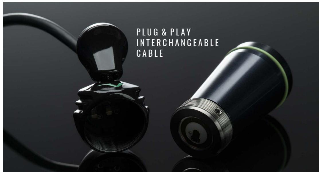
PLUG & PLAY INTERCHANGEABLE CABLE